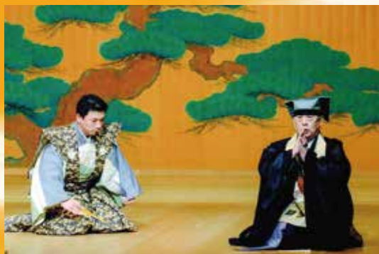
布施無経