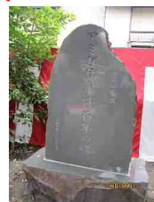
アミガサ事件100年の碑