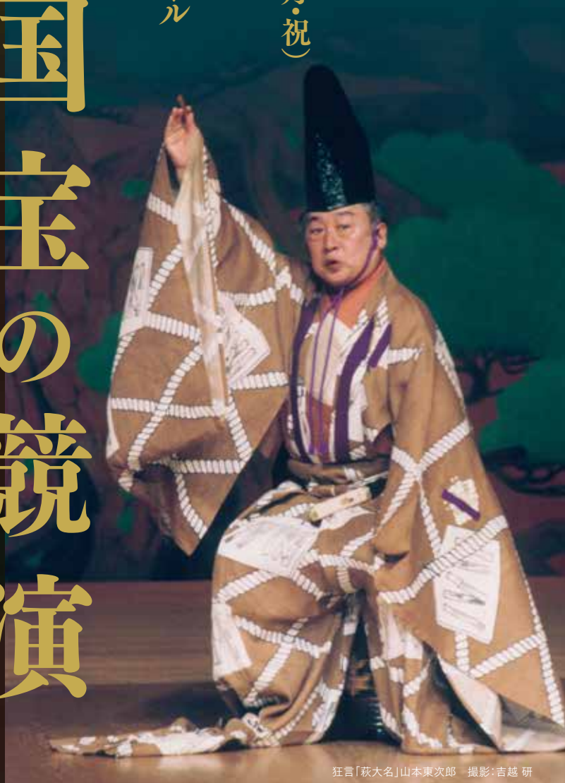
狂言「萩大名」山本東次郎