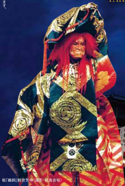
能「鶉飼」観世芳伸

※雨天時は会場スペースの都合により、S席チケット購入者のみのご入場とさせていただきます。