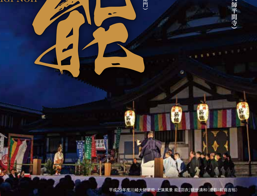
平成29年度川崎大師薪能 上演風景 能「羽衣」観世清和

■チケット取扱所 好評発売中 「※」は窓口販売のみ。電話予約は受け付けておりません。